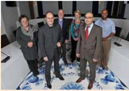
Partij van de Arbeid