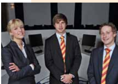
Studenten Techniek in Politiek