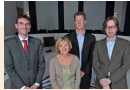
Christen Democratisch Appèl