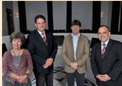
Volkspartij voor Vrijheid en Democratie